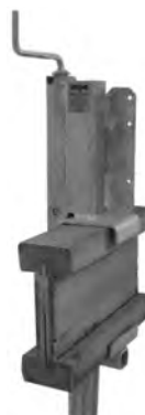
vkládací základní prvek pro nosníky