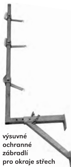
výsuvné ochranné zábradlí pro okraje střech